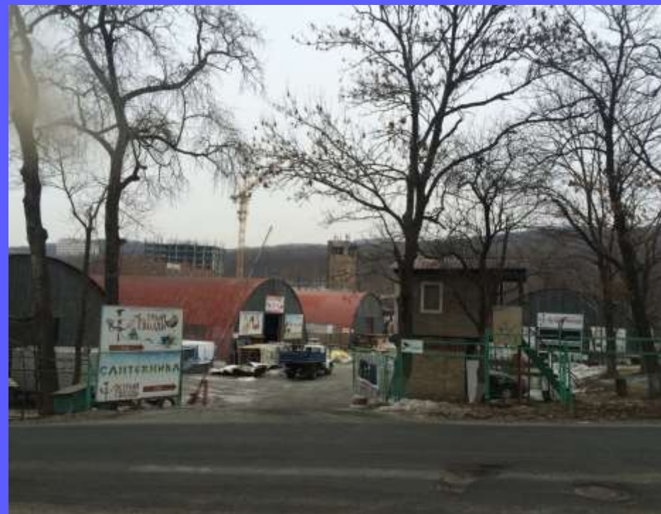
Склады. Институт химии сдает в аренду

К теме о распределении финансовых ресурсов... ...или категории «угодных» и «не очень»