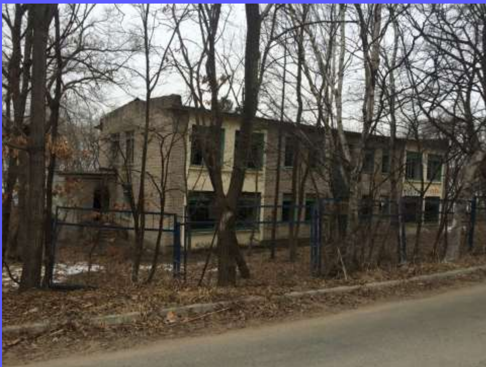
Здание института математики